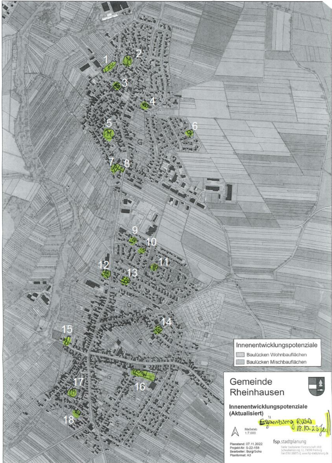
Abbildung: Verortung weiterer Innenentwicklungspotenziale – Ergänzung RVSO (18.10.2023)